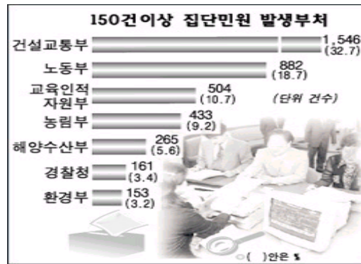
<그림 II-1> 2001년도 집단민원 발생동향

한편, 국민고충처리위원회에 따르면 2001년도 한 해 20명 이상이 연명으로 제기한 집단민원의 절반 가량은 해결된 것으로 나타났다. 각급 행정기관에서 발생한 15,926건의 집단민원 가운데 47.7%인 7590건의 민원이 행정기관과 민원인들간의 중재를 통해 해결됐다고 밝힌 바 있다. 145) 집단민원 가운데 49.3%인 7,856건은 법령에 어긋나거나 무리한 요구 등의 이유로 종결처리됐고 480건(3%)은 현재 진행 중이다. 민원 발생 건수는 2000년보다 5.5%(836건) 증가했다. 집단행동은 2001년 모두 765건으로 전년도에 비해 22건(3%) 늘어났다. 자치단체를 상대로 한 집단행동은 554건으로12.5%(79건)가 줄어든 반면, 국가기관은 국방관련 민원 때문에 211건으로 지난해보다 무려 91.8%(101건)가 증가했다. 기관별 민원발생은 서울시가 2,530건으로 가장 많았고 경기 1,960건, 건설교통부 1,546건, 부산시 984건 등의 순이었으며 분야별로는 건설교통 9,021건, 환경공해 1,479건, 농림산림 1,111건 등의 순이었다. 각종 인·허가에 대한 처분기준을 설정, 공표하는 등 열린 행정을 지향하고 현실에 맞지 않거나 행정편의주의적인 법령·제도는 지속적으로 개선, 정비해야 할 필요성이 제기되었다.