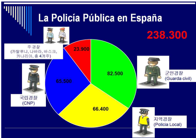
<스페인 경찰인력 현황>