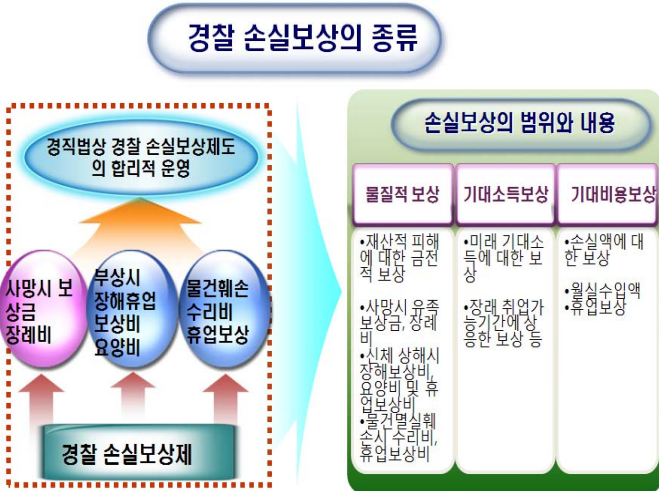
<그림 1> 경찰 손실보상의 종류와 범위