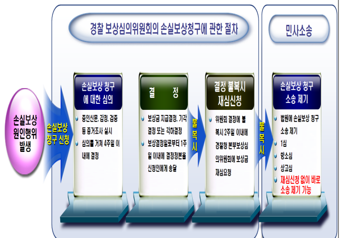
<그림 2> 경찰 손실보상 청구 및 진행절차 흐름도

경찰의 손실보상 신청절차와 처리과정을 개략적으로 제시하면 <그림 2>와 같다. PSI